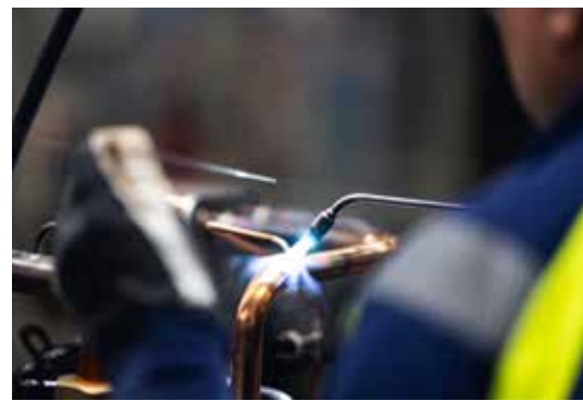
HÖGTEKNOLOGISKT ARBETE. På Thermia i Arvika erbjuds en kombination som få arbetsplatser kan matcha: Närheten till naturen och ett högteknologiskt arbete med framtidens produkter.

– Arvika och Värmland är hjärtat i vår verksamhet. Vår ambition är därför också att vara en positiv kraft i samhällsutvecklingen, säger företagets vd Magnus Glavmo.