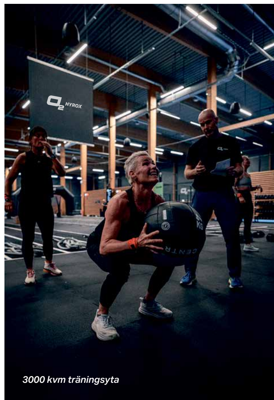
3000 kvm träningsyta