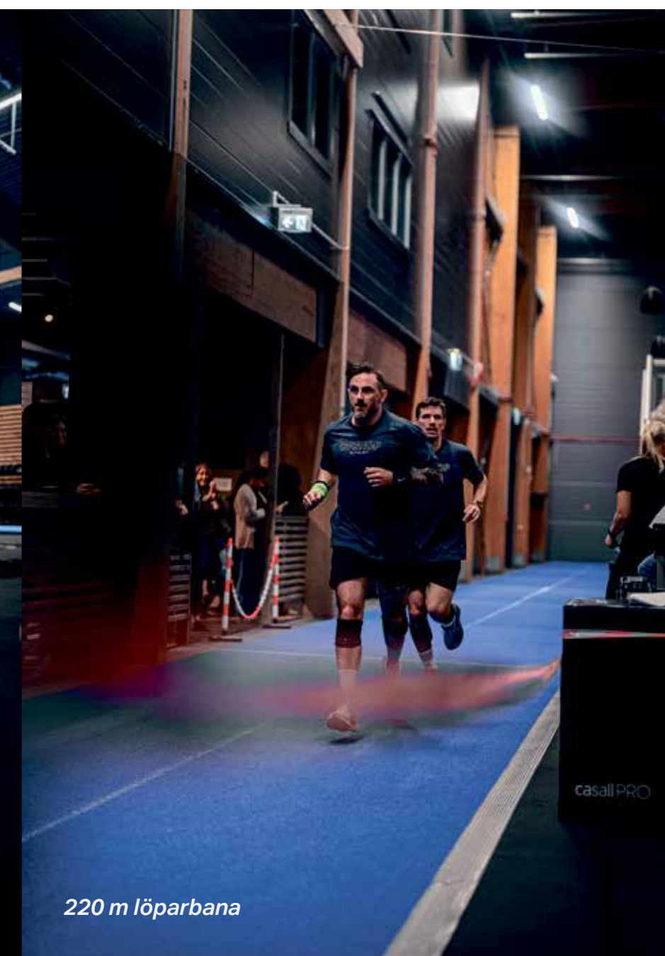
220 m löparbana