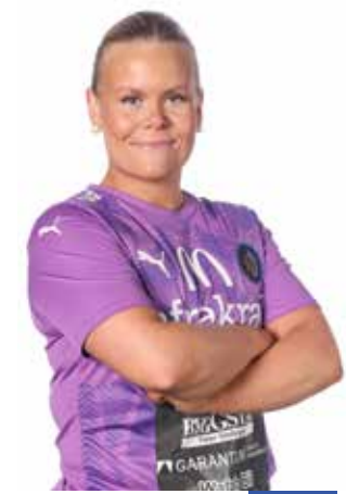
MOA MILL 91 Målvakt, född 11/2 2005 i Skoghall, Moderklubb: IFK Skoghall Dam Kom från: IFK Skoghall Dam 2022