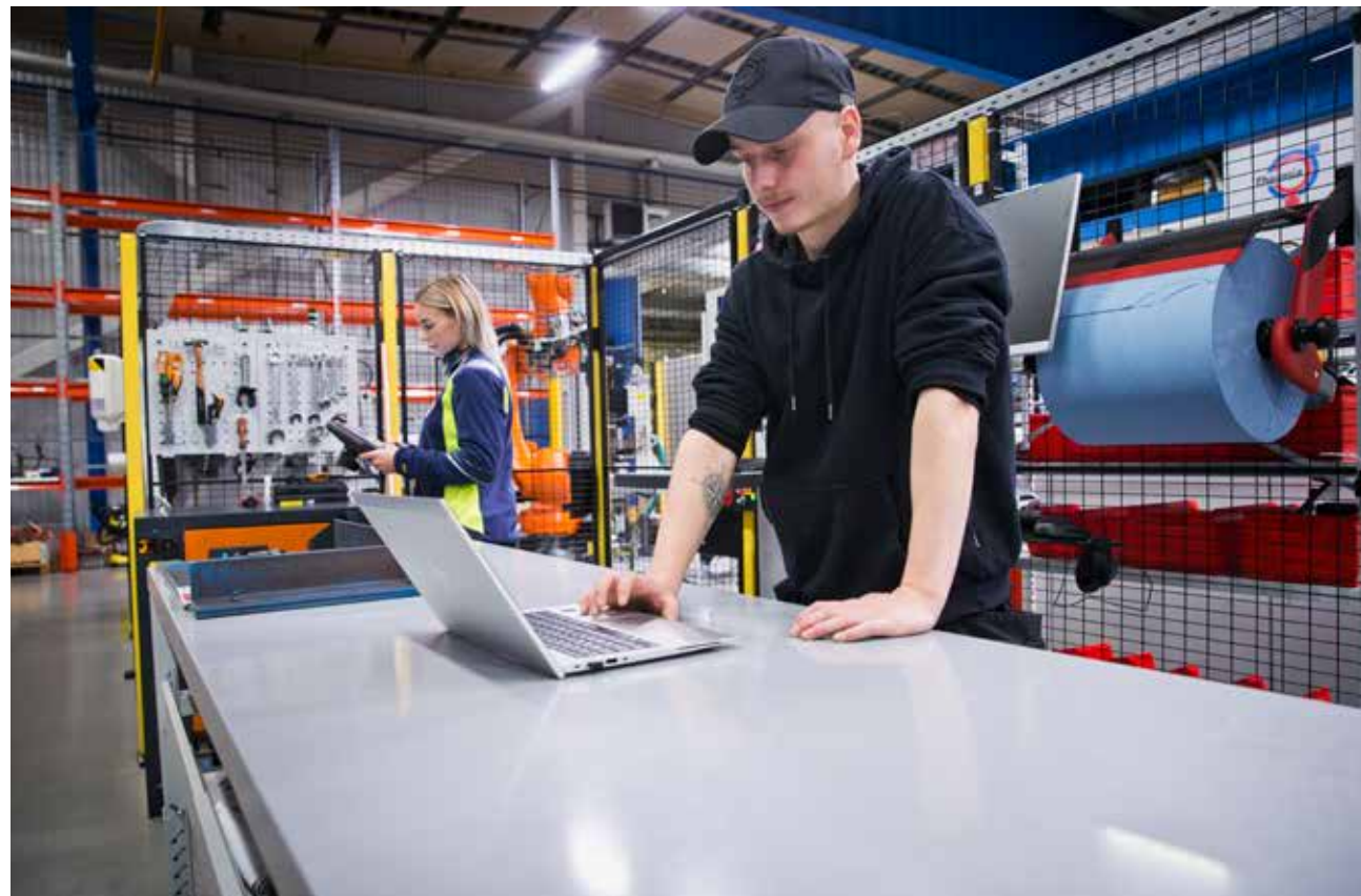
FRAMTIDSPRODUKT. På Thermia i Arvika utvecklas framtidens värmepumpar – teknik som värmer och kylvärmer hem över hela Europa.

– Det pågår just nu ett intensivt och tvärfunktionellt