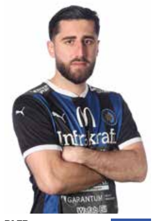
DLER MOSA 5 Född: 6 augusti 2002 Position: Försvar Kom från: Rätöps IF 2025