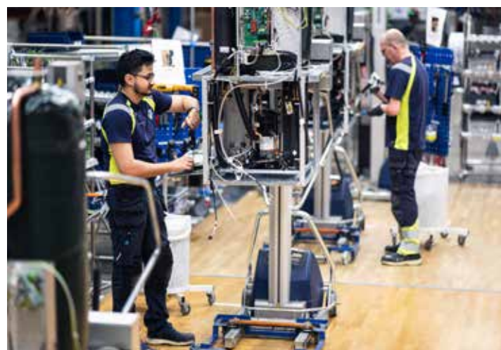
PRODUKTIONEN VÄXER. Under året har omkring 40 nya medarbetare anställts och nya produktionslinor byggs för framtiden.

Inför den kommande säsongen är optimismen stor: – Det ska bli otroligt roligt och spännande att följa både dam- och herrlagen. Det har gjorts intressanta nyförvärv så jag tror att alla lag har goda chanser att utmana i toppen. Det ska bli fantastiskt roligt att följa!