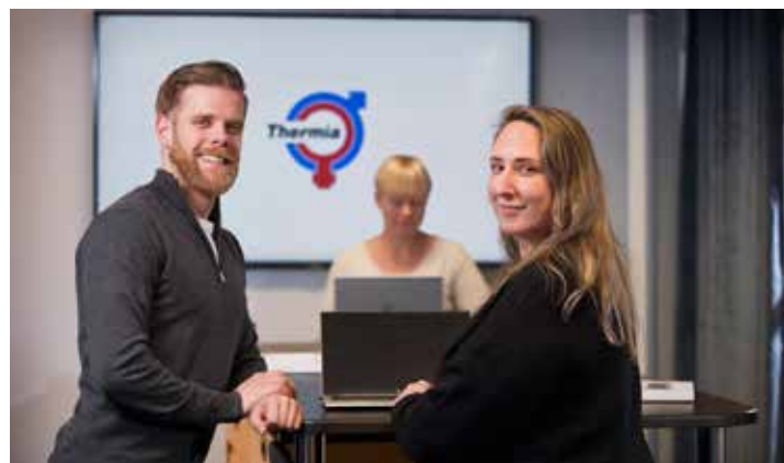
KARRIÄR. Det finns gott om karriärmöjligheter på Thermia i Arvika, där hela kedjan finns representerad: Från forskning och utveckling till produktion och eftermarknadshantering.